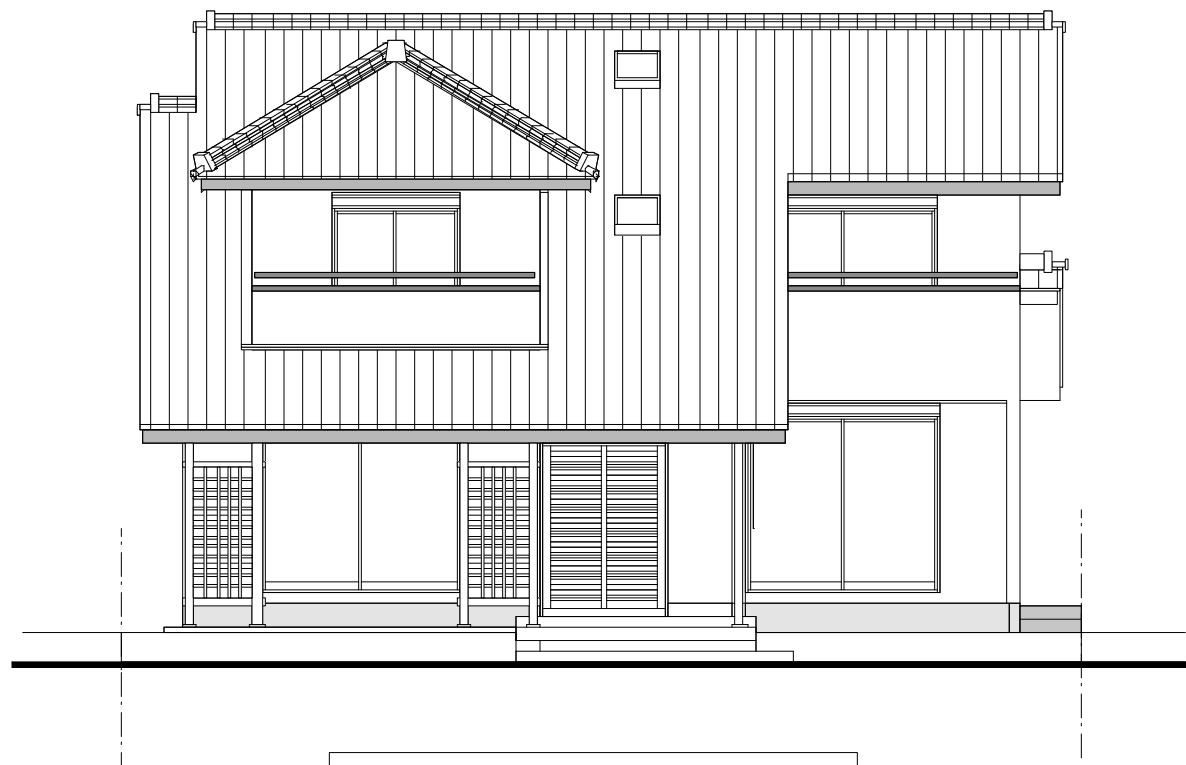
南側 立面図 1/100