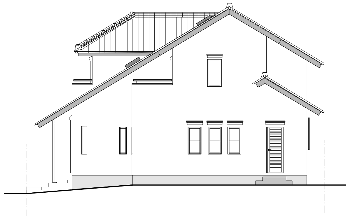
東側 立面図 1/100